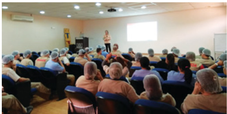
Empresa passou a realizar as reuniões para integrar e informar equipe sobre medidas de segurança

Além de receber informações técnicas, os funcionários também podem opinar, tirar dúvidas e dar sugestões.