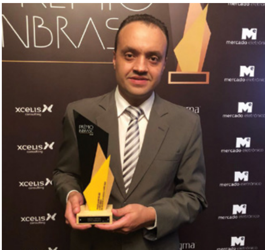
Emerson conquistou o prêmio de melhor projeto do ano em Supply Chain, área em que fez um MBA

E o que foi aprendido durante todo o MBA vai ajudá-lo a contribuir com melhorias também dentro da Emibra, onde a área de logística é bastante valorizada, já que ela tem grande participação na integração de todos os outros setores da companhia.