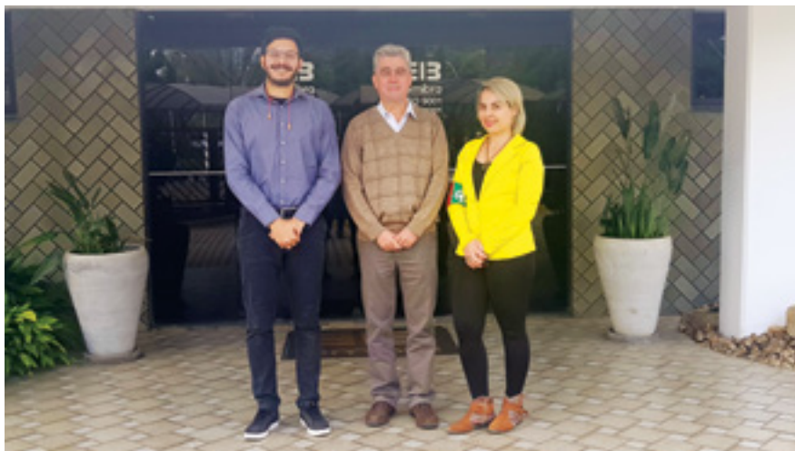
Equipe da certificadora DNV esteve na Emibra para avaliar se a fábrica atende a todas as medidas exigidas para obter a recertificação da ISO 9001 e da ISO 14001

A Emibra conquistou a primeira fase das recertificações da ISO 9001, que trata de qualidade de gestão, e da ISO 14001, que refere-se ao desempenho ambientalmente correto. As recertificações correspondem à versão 2015 das normas, ou seja, a mais atualizada, e foi concedida pela DNV, especializada no trabalho.