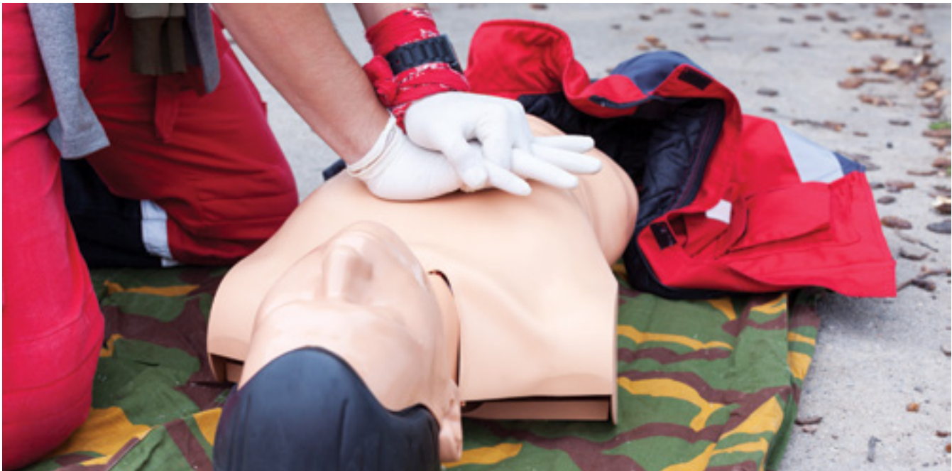
Grupo que faz parte da brigada de incêndio participou de diversos treinamentos, que são realizados anualmente para manter os conhecimentos atualizados

tes, tudo para aumentar a proteção e tornar a brigada mais forte. Além dos treinamentos, a equipe passa periodicamente por testes de conhecimentos diante de qualquer ocorrência.